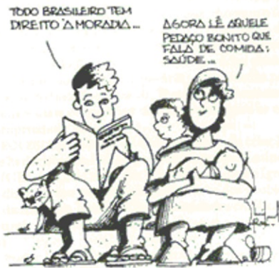
(Charge de Miguel Paiva, O Estado de S. Paulo , 5/10/88 — ed. histórica, p. 3)

Analise a charge abaixo para responder à questão: