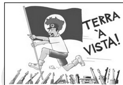
IMAGEM 2 – Ocupação do MST

Sendo assim, as discussões entre a relação passado-presente, rupturas-mudanças-permanências o professor poderá propor a partir das imagens acima sobre: