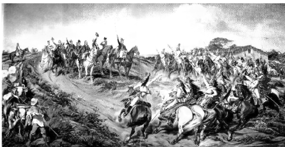
Independência ou Morte (óleo sobre tela, 1888)

33. Em uma turma do ensino fundamental um professor de História propôs uma aula sobre a independência do Brasil a partir do quadro de Pedro Américo, no qual demonstraram interesse em compreender como ocorreu aquele processo.