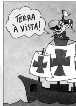
IMAGEM 1 – Cabral chegando ao Brasil

34. Na aula de História sobre a formação e ocupação latifundiária no Brasil o professor apresentou para os alunos duas imagens, a primeira representando um fato do século XVI e a segunda do século XX: