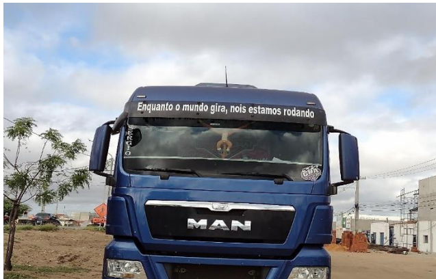
Caminhão estacionado em cidade pernambucana.