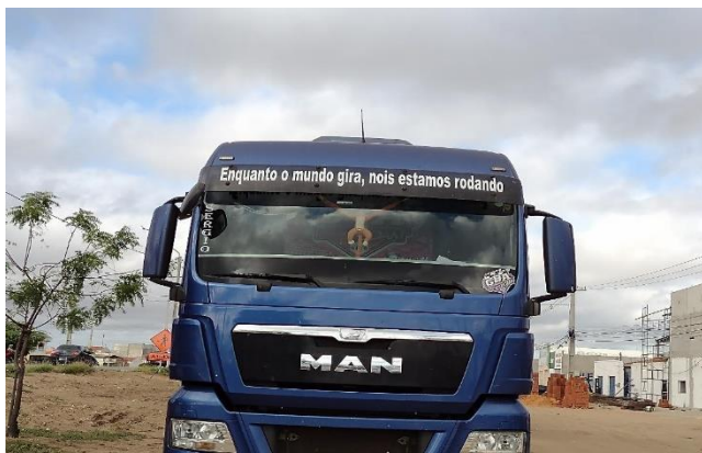
Caminhão estacionado em cidade pernambucana.