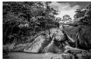
Disponível em: <http://http://adventure.esporteblog.com>.