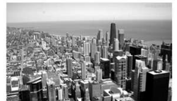
Disponível em: <http://wallpaper.ultradownloads.com.br>.

Ciência que estuda elementos físicos, biológicos e humanos, e suas relações com o planeta Terra, a Geografia tem como principal objetivo compreender a relação do homem com o meio ambiente, as condições climáticas e as características do espaço geográfico. Os espaços apresentados acima: