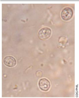
Oocistos de parede espessa do C. parvum , nesta amostra de fezes, possuem cerca de 3 mm de diâmetro (Microbiologia de Brock, 2016).

O Cryptosporidium parvum infecta diversos animais de sangue quente, em particular o gado bovino. O C. parvum produz cistos de parede espessa, altamente resistentes, chamados de oocistos, os quais alcançam a água por meio das fezes de animais infectados. A infecção é, então, transmitida a outros animais e a seres humanos quando estes bebem a água contaminada com fezes.