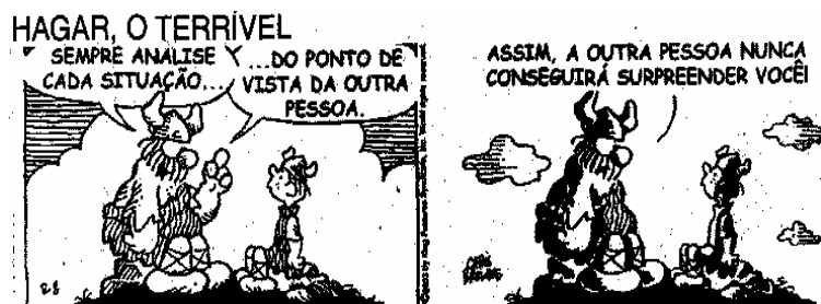
BROWNE, Chris. Hagar, o terrível. A Tarde , Salvador, 9 abr. 2006. Caderno 2, p. 8. Passatempos.