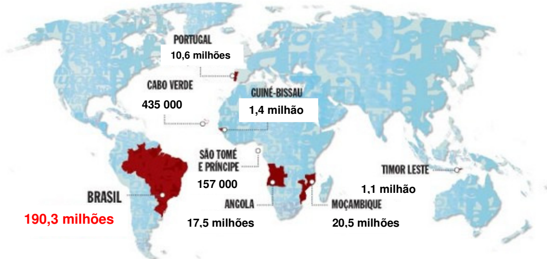
Ilustração: Revista VEJA

Como estão distribuídos os cerca de 240 milhões de cidadãos lusófonos abarcados pelo novo acordo ortográfico