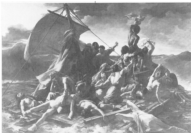
Figura I – Géricault. A Jangada da Medusa, 1818-19. Louvre, Paris.