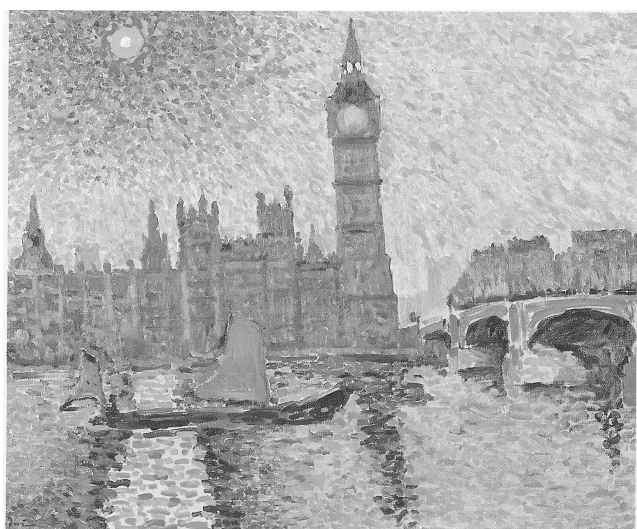
Figura II – Derain. Big Ben, 1905. Troves, coleção particular.

Existe uma diferença entre ver e ter um olhar sobre a obra de arte – a diferença entre ver e sentir. Para se analisar um quadro, podem ser utilizadas várias abordagens, com enfoque sobre elementos que incluem, entre outros, composição, movimento, unidade, equilíbrio, cor, contraste claro/escuro e clima.