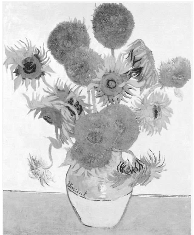
Vincent van Gogh. Girassóis, 1888, óleo sobre tela, 92,1 cm × 73 cm.

A observação e a memória trabalham juntas nos procedimentos de análise. De uma percepção mais geral, o analista segue para a decomposição das partes do objeto observado. Esse método é uma espécie de roteiro a ser seguido na análise dos elementos que compõem o objeto. Acerca da análise da obra apresentada acima, assinale a opção correta.