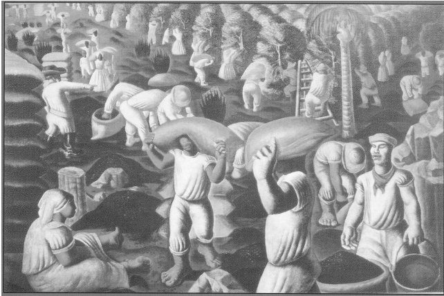
Cândido Portinari. Café , óleo sobre tela, 1935, 130 cm × 195 cm.

A figura acima apresenta um dos quadros mais famosos do artista Cândido Portinari. Com relação às características do quadro apresentado, assinale a opção correta.