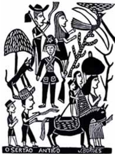
J. Borges. O Sertão Antigo . Xilogravura, s/d. Galeria Brasileira. Internet: <Researchgate.net>.

Tendo como referência inicial a imagem precedente, julgue os itens subsequentes, a respeito da cultura popular e suas linguagens artísticas.