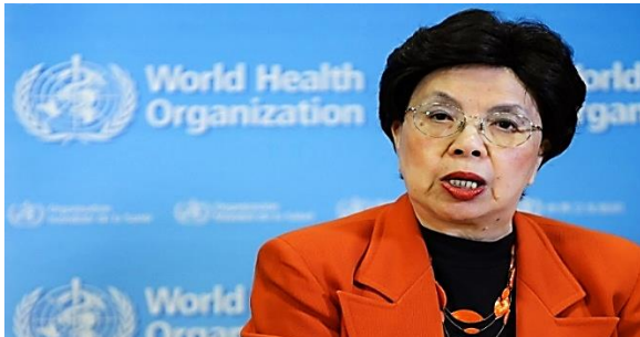
Margaret Chan, diretora-geral da OMS, fala a jornalistas nesta segunda-feira (1º), em Genebra, sobre a emergência em saúde pública devido ao zika vírus e à microcefalia

Anúncio foi feito em coletiva de imprensa nesta segunda-feira. Órgão pediu ação internacional coordenada contra a doença.