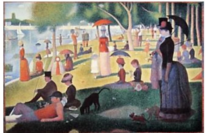
Fonte: Domingo à tarde na Ilha Grande Jatte. Georges Seurat. França. 1884-86.

51. A cultura visual contemporânea, atualmente, desafia nosso próprio conceito de ensino e aprendizagem, assim como desafia também os sentidos e as definições da própria arte. A linguagem visual transmite ideias e sensações através de símbolos que causam um maior impacto e efeito no observador do que a linguagem conceitual (oral e escrita) em alguns momentos. Observe a imagem