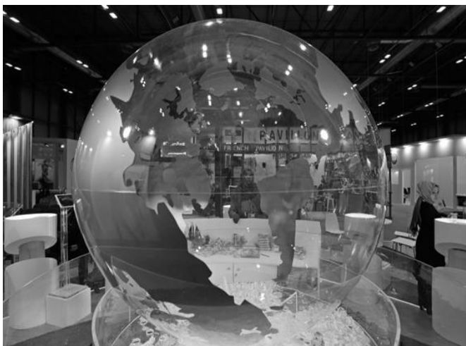
Globo terrestre na conferência do clima de Madri, COP 25, em 13 de dezembro de 2019

A Cúpula de Líderes sobre o Clima, reunião para discutir questões climáticas junto a 40 nações, entre elas o Brasil, é o mesmo o que COP 26?