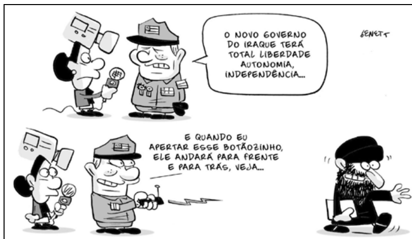
(Alberto Benett http://www.charge-o-matic.blogspot.com.br/2005_05_01_archive.html )

O contexto correto dessa ilustração pode ser descrito na seguinte afirmativa como: