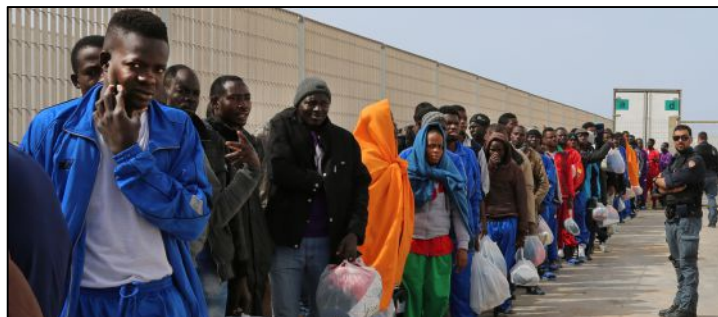
(Grupo de imigrantes em Lampedusa.)

Na conjuntura mundial atual, as manchetes jornalísticas e a imagem retratam