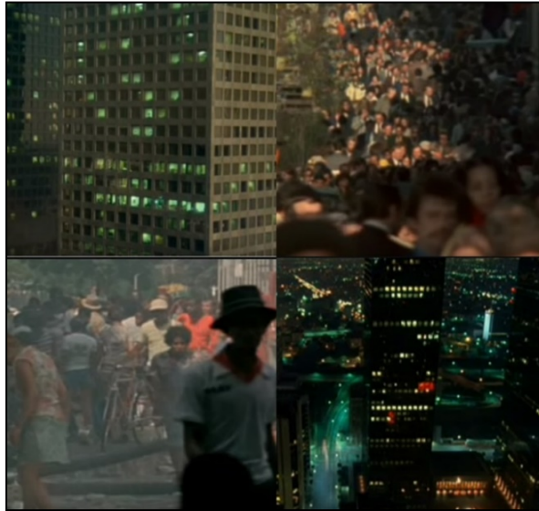
(Cenas do filme Koyaanisqatsi: Uma vida fora de controle , de Godfrey Reggio (1982), Miramax Films. Disponível em: https://g1.globo.com/sc/santa-catarina/especial-publicitario/falando-de-sustentabilidade/noticia/2019/01/03/urbanismo-sustentavel-entenda-o-conceito-que-estimula-a-criacao-de-espacos-para-o-convivio-humano.ghtml .)