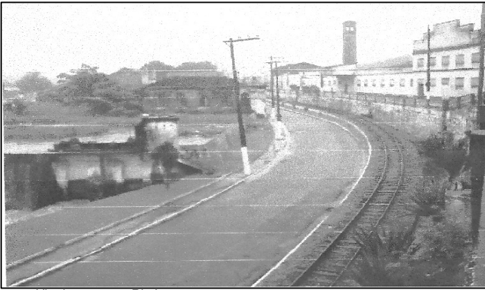
Via de acesso a Rio Largo.