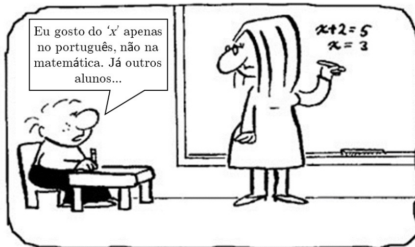
(Adaptado de: < https://www.somatematica.com.br/piadas2.php >. Acesso em: 5 mar. 2019.)

Um colégio possui 300 alunos matriculados. Entre esses alunos, a probabilidade de se encontrar aleatoriamente um estudante que gosta de matemática, mas que não gosta de português, é de 25%. Além disso, existem 105 alunos matriculados que não gostam de ambas as disciplinas.