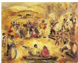
Figura 3: Samba (1943-45)