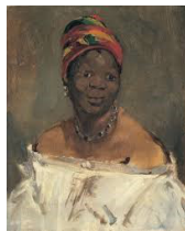
Figura 5: A crioula (estudo para a preta da Olympia). (La Négresse). Óleo sobre tela, 61X50 cm, 1862-3.