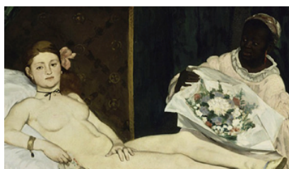
Figura 6: Impressionismo: Olímpia de Edouard Manet.

A relação entre a obra “Olímpia” (figura 6) e o estudo feito anteriormente por Manet em “a crioula” (figura 5) evidencia que o artista estava fortemente influenciado pela sua estadia no Rio de Janeiro, no ano de 1849.