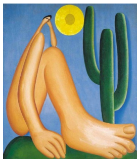
Figura 1: Abaporu (1928)

A partir do texto acima, associe as imagens das obras às possíveis autorias, quer de Tarsila do Amaral e/ou de Anita Malfatti, verificando nelas, características que correspondam à realidade social brasileira e ao movimento antropofágico: