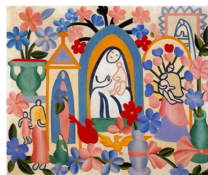
Figura 4: Religião Brasileira (1927)