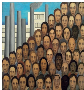
Figura 2: Operários (1933)