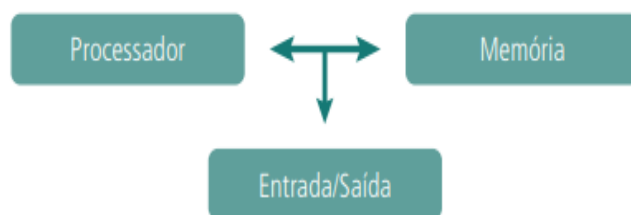
Figura: Elementos de hardware de um computador.

18) As partes físicas de um computador, tais como: dispositivos de entrada e saída (ex.: monitor, teclado, impressora, webcam), dispositivos de armazenamento (ex. memória volátil e permanente), processador, assim como todo o conjunto de elementos que compõem um computador são chamados de hardware. A figura a seguir, apresenta os elementos que compõem o hardware.