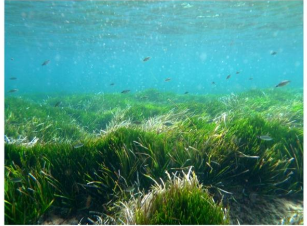
Posidonia Oceanica Sea Grass #0910 - 0953 (100,000 years old; Balearic Islands, Spain)