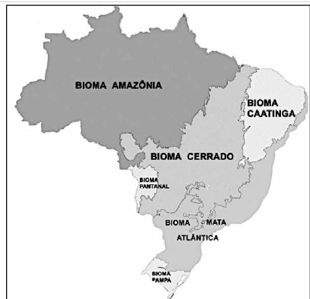
( http://www.ibge.gov.br/home/presidencia/noticias/21052004biomashtml.shtml )

Com relação aos biomas brasileiros representados no mapa acima, assinale V para a afirmativa verdadeira e F para a falsa.