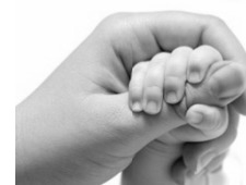
Reflexo de preensão palmar

Assinale a alternativa que identifica corretamente os episódios que ilustram fatos sociais , segundo a definição durkheimiana.