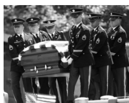
Cermônia militar fúnebre