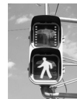
Código de trânsito