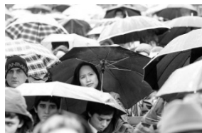
Guarda-chuvas abertos em dia chuvoso