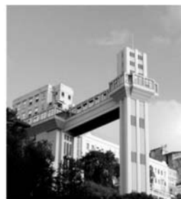
II - Elevador Lacerda