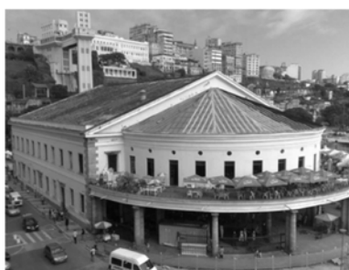
IV - Mercado Modelo

Com base nas imagens, podemos afirmar que o modernismo arquitetônico está representado em