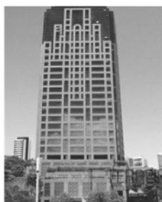
III - Edifício Suarez Trade Center