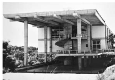
I - Faculdade de Arquitetura da UFBA

Observe as imagens a seguir, que exemplificam diversas tendências arquitetônicas presentes na cidade de Salvador.