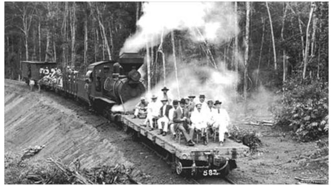
Autoridades em inauguração de trecho da EFMM, em 1912.

A história da construção da Estrada de ferro Madeira-Mamoré (EFMM) remonta à segunda metade do século XIX, quando começa a ser idealizada, mas será a assinatura do Tratado de Petrópolis (1903) que estabelecerá sua efetiva concretização. A ferrovia passou a funcionar entre Porto Velho e Guajará-Mirim, em 1912.