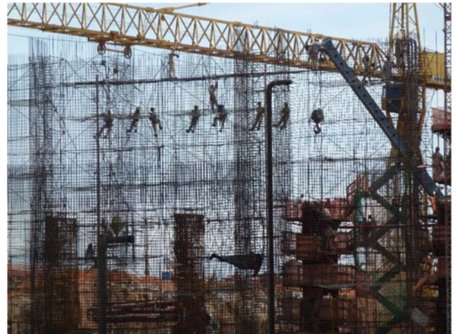
"Acrobatas de Santo Antônio"- Operários no canteiro de obras da Usina Hidrelétrica de Santo Antônio (2012)

As opções a seguir apresentam impactos políticos e socioambientais decorrentes da ampliação da infraestrutura energética rondoniense, à exceção de uma . Assinale-a.