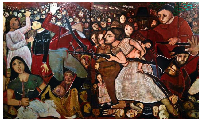
Detalhe do painel

O painel se inspira na Batalha de Tejucupapo (1646), que ficou famosa pela participação vitoriosa das mulheres daquele vilarejo na luta contra os holandeses.