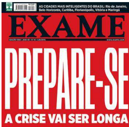
Fonte: Exame , de 5 de agosto de 2015.

O Brasil enfrentou uma forte crise econômica entre abril de 2014 e dezembro de 2016, e, ao longo desse período, ocorreu uma retração do Produto Interno Bruto (PIB).