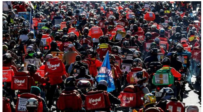
Entregadores realizam marcha em São Paulo (01/07/2020).

Durante a pandemia, a mobilização dos entregadores de aplicativos levantou um debate sobre suas condições de trabalho em uma economia cada vez mais “uberizada”.