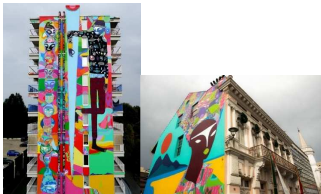
Mural em Amsterdam (2014). "Preta do Sul", Curitiba (2017).

A Figura I retrata a lateral de um prédio de um conjunto habitacional na periferia de Amsterdam, onde moram imigrantes provenientes das colônias holandesas, na qual o artista pintou um totem gigante de cabeças sobrepostas que lembram afrodescendentes, com seus turbantes e tatuagens coloridas. Ao lado do totem, pintou a figura de um dançarino negro.