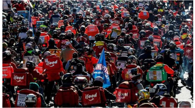
Entregadores realizam marcha em São Paulo (01/07/2020).

Durante a pandemia, a mobilização dos entregadores de aplicativos levantou um debate sobre suas condições de trabalho em uma economia cada vez mais “uberizada”.