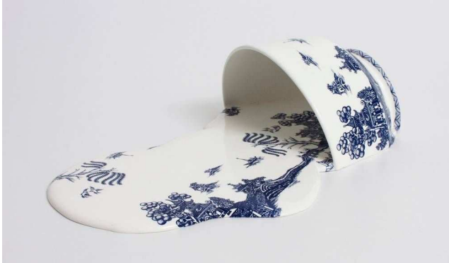
Livia Marin, Nomand Patterns , Impressão e esmalte em cerâmica e resina (2012).

A escultora chilena Livia Marin, na série Nomand Patterns (Padrões Nômades), criou um conjunto de peças a partir de fragmentos de xícaras e pratos que lembram a cerâmica inglesa vitoriana azul e branca, de inspiração chinesa. A obra retoma as cerâmicas em azul e branco do século XIX, quando eram sinal de prestígio e estavam associadas às classes aristocráticas, e mostra como em nossos dias elas foram massificadas por uma produção em larga escala.