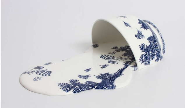
Livia Marin, Nomand Patterns , Impressão e esmalte em cerâmica e resina (2012).

A escultora chilena Livia Marin, na série Nomand Patterns (Padrões Nômades), criou um conjunto de peças a partir de fragmentos de xícaras e pratos que lembram a cerâmica inglesa vitoriana azul e branca, de inspiração chinesa. A obra retoma as cerâmicas em azul e branco do século XIX, quando eram sinal de prestígio e estavam associadas às classes aristocráticas, e mostra como em nossos dias elas foram massificadas por uma produção em larga escala.