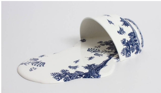
Livia Marin, Nomand Patterns , Impressão e esmalte em cerâmica e resina (2012).

A escultora chilena Livia Marin, na série Nomand Patterns (Padrões Nômades), criou um conjunto de peças a partir de fragmentos de xícaras e pratos que lembram a cerâmica inglesa vitoriana azul e branca, de inspiração chinesa. A obra retoma as cerâmicas em azul e branco do século XIX, quando eram sinal de prestígio e estavam associadas às classes aristocráticas, e mostra como em nossos dias elas foram massificadas por uma produção em larga escala.