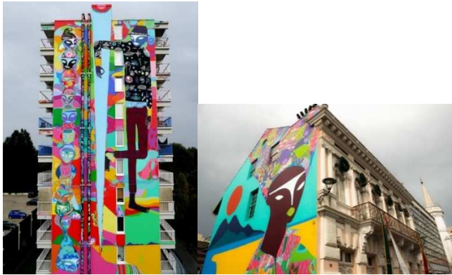
Mural em Amsterdam (2014). "Preta do Sul", Curitiba (2017).

A Figura I retrata a lateral de um prédio de um conjunto habitacional na periferia de Amsterdam, onde moram imigrantes provenientes das colônias holandesas, na qual o artista pintou um totem gigante de cabeças sobrepostas que lembram afrodescendentes, com seus turbantes e tatuagens coloridas. Ao lado do totem, pintou a figura de um dançarino negro.