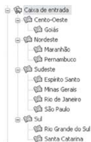
Esquema 1: Caixa de Entrada: