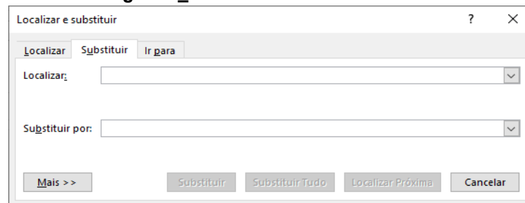
Figura 1_Janela Localizar e Substituir

No Word Professional Plus 2013, versão em português, o atalho que permite acessar a janela Localizar e Substituir é