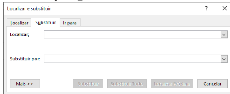
Figura 1_Janela Localizar e Substituir

No Word Professional Plus 2013, versão em português, o atalho que permite acessar a janela Localizar e Substituir é