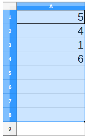
Figura 2 – Visão parcial de uma planilha do programa Calc do Pacote LibreOffice 5.0, em sua configuração padrão

QUESTÃO 24 – Presuma que o usuário deu apenas um clique com o botão esquerdo do mouse, configurado para destros, sobre o ícone Soma \Sigma . Considere ainda que foram selecionadas somente as células de A1 até A8, conforme Figura 2 abaixo. Em que endereço de célula ficará o valor da soma?