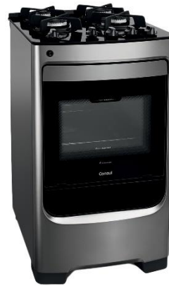
VALOR: R$ 650,00

A loja em que Ingrid realizará a compra ofereceu 12% desconto no produto de menor valor e 6% no de maior valor, sabendo dessa informação, qual foi o valor da compra de Ingrid?