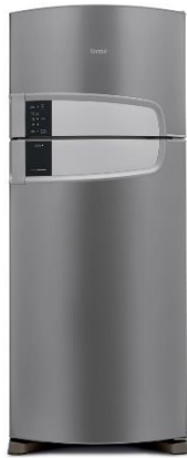
VALOR: R$ 2.340,00

QUESTÃO 37 – Ingrid está montando sua casa nova e aguardou até a Black Friday para comprar a geladeira e o fogão de seus sonhos, conforme imagens abaixo: