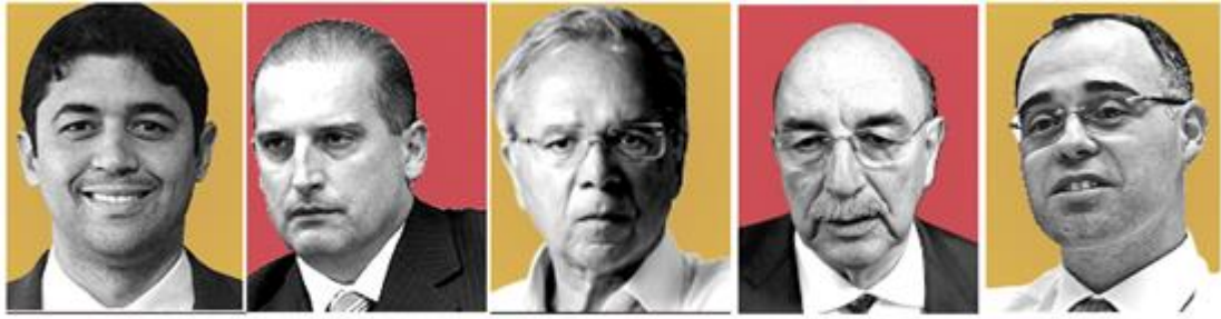
Wagner Rosário (1) Onyx Lorenzoni (2) Paulo Guedes (3) Osmar Terra (4) André Mendonça (5)

QUESTÃO 30 – Relacione os atuais Ministros da República Federativa do Brasil, conforme numeração do quadro abaixo, aos respectivos Ministérios, listados na Coluna 1.