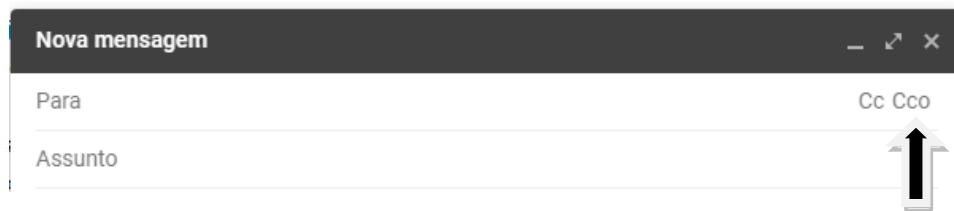
Figura 2 – Visão parcial da tela do Gmail, versão atualizada, em sua configuração padrão

QUESTÃO 22 – Conforme mostra a seta, na Figura 2 abaixo, no Gmail, qual a tecla de atalho que permite ao usuário adicionar o destinatário "Cco"?