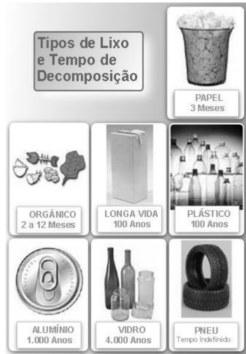
Imagem I, para responder às questões 6 e 7.

Internet: < http://www.casaideal.wordpress.com/reduza-reutilize-recicle/ >. Acesso em 3/1/2010.