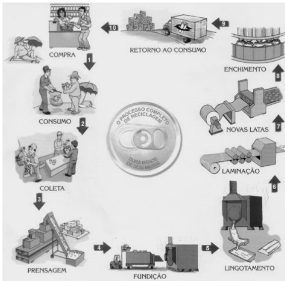
Imagem III, para responder à questão 7.

Internet: < http://angloambiental.wordpress.com/2009/09/ >. Acesso em 3/1/2010.