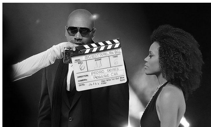
Figura para responder às questões 24 e 25.