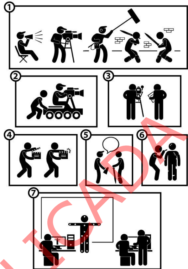
Figura para responder às questões de 28 a 31.

Internet: < http://imgkid.com > (com adaptações).