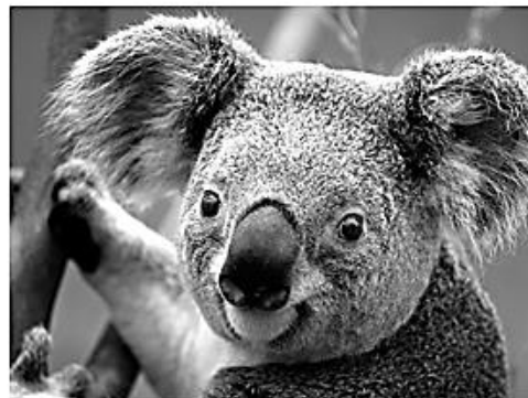
Figura 2 COALA