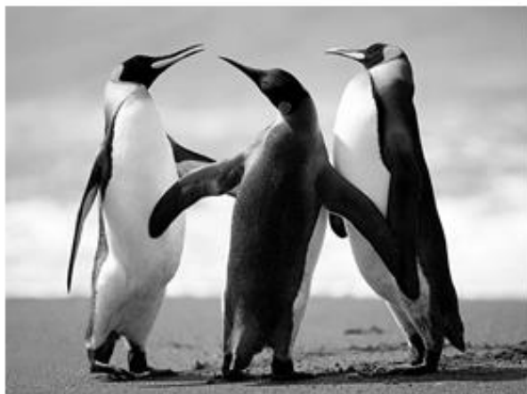
Figura 1 PINGUINS

38. Uma estudante de biologia está confeccionando um artigo científico no Word 2010, em sua configuração padrão. Uma das exigências da revista para publicar o artigo é que todas as imagens estejam numeradas e com nome. Para automatizar este trabalho, a estudante optou por utilizar o recurso “Inserir Legenda”, que além de numerar automaticamente a figura também é possível dar nome a ela. Assinale a alternativa que corresponda ao local para acessar esta ferramenta.