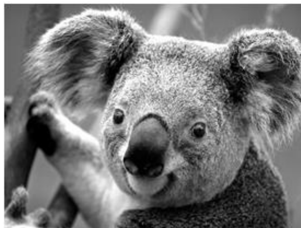
Figura 2 COALA