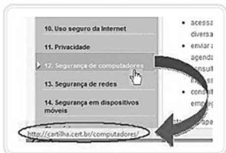
Figura 4.18: Verificação do endereço de um link

[...] Os links podem estar associados à execução de programas maliciosos. Você pode verificar isso no momento de passar o mouse sobre o link . O endereço do objeto do link aparece no canto inferior esquerdo da tela, como é mostrado na Figura 4.18.