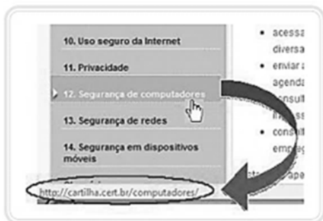
Figura 4.18: Verificação do endereço de um link

[...] Os links podem estar associados à execução de programas maliciosos. Você pode verificar isso no momento de passar o mouse sobre o link. O endereço do objeto do link aparece no canto inferior esquerdo da tela, como é mostrado na Figura 4.18.