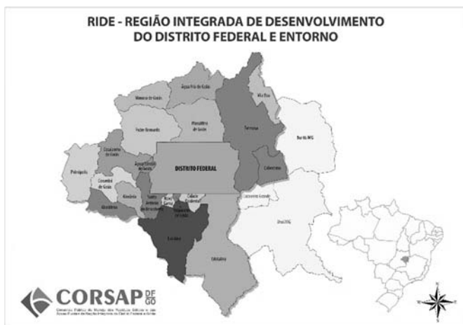
(Figura ampliada na página 13)

Levando-se em consideração o mapa da Região Integrada de Desenvolvimento do Distrito Federal e do Entorno (RIDE/DF), assinale a alternativa correta.