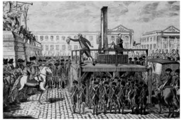
Execução de Luis XVI, em 21 de janeiro de 1793. /www.google.com.br/search?q=revolu%C3%A7%C3%A3o+francesa+guilhotina+e+terror , consultado em 25/07/2018

As execuções na guilhotina expressam a radicalização do processo revolucionário francês. Os Jacobinos, no período denominado Convenção (1792-1795), desencadearam o Terror da Revolução Francesa, durante o qual o(a):