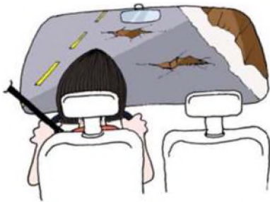
Ilustração do Manual DENATRAN, página 35

Estudos mostram que os motoristas podem dirigir de modo muito mais seguro do que habitualmente o fazem, mas é necessário dirigir analisando as situações e verificando tudo que possa afetá-lo, e assim tomar decisões com antecedência, ou seja, dirigindo de forma preventiva. Observe a figura a seguir.