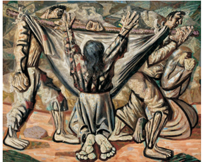
Entero na rede, 1944 - MASP

A obra representada acima possui acentuado caráter social e traços do expressionismo, algumas das características mais marcantes do seu autor: