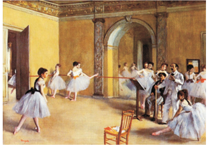
O foyer de dança no Ópera, Edgar Degas, Museu D'Orsay, Paris (1872).

Do interior da Ópera de Paris, Degas retratou diversas cenas, como as da imagens acima. Usando movimentos, cores e pinceladas suaves, compôs suas telas, onde bailarinas com suas sapatilhas e seus tutus volumosos, fazem exercícios na barra ou apresentam seus movimentos graciosos, enquanto o professor e o músico da aula avaliam seus desempenhos.